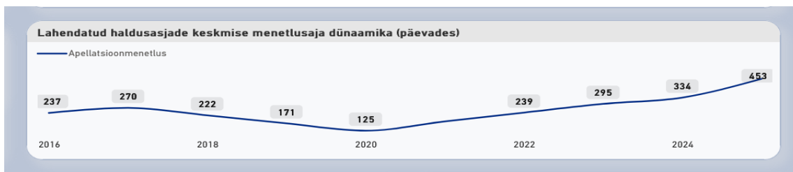
Joonis 1. Tallinna Ringkonnakohtu apellatsioonimenetluse keskmine aeg (päevades) aastatel 2016–2026 1

Lisaks tuleb märkida, et seadusest tuleneva nõude tõttu lahendatakse osa kohtuasju keskmisest kiiremini (eelkõige riigihanked, Eesti kodaniku välisriigile väljaandmine, rahvusvaheline kaitse vms), mis tähendab, et nn tavapärase apellatsioonkaebus ootab Tallinna Ringkonnakohtus kohtuotsust 1,5 aastat ja kauemgi. Samuti tuleb arvesse võtta, et menetlusosalise seisukohast tuleb siia lisada ka halduskohtu menetlusaeg, sellisel juhul kujunes 2025. aastal haldusasjade lahendamise keskmiseks ajaks 717 päeva. Seda ei saa pidada mõistlikuks menetlusajaks.